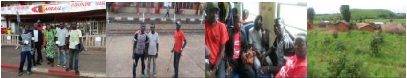
En route pour le Grand Nord : Gare de Yaoundé, embarquement, installation dans le train et paysage avec maisons style sahélien