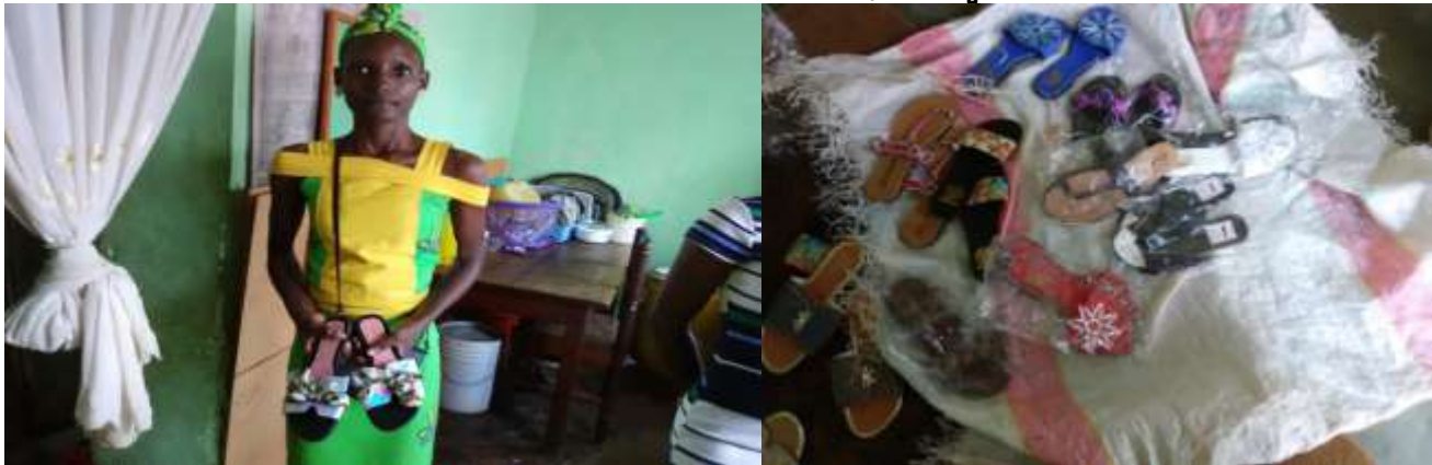
Merra, Universitaire en Lettres bilingues, notre dernière-née qui a choisi de vendre les sandales pendant les vacances