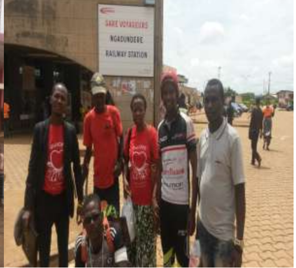
Traversée et arrivée à Ngaoundéré