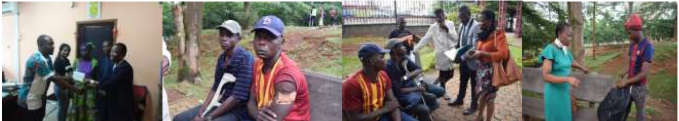
Remise don Bakari agressé et Victor accidenté et N/équipe pour leur prise en charge Dusmanou retour en famille